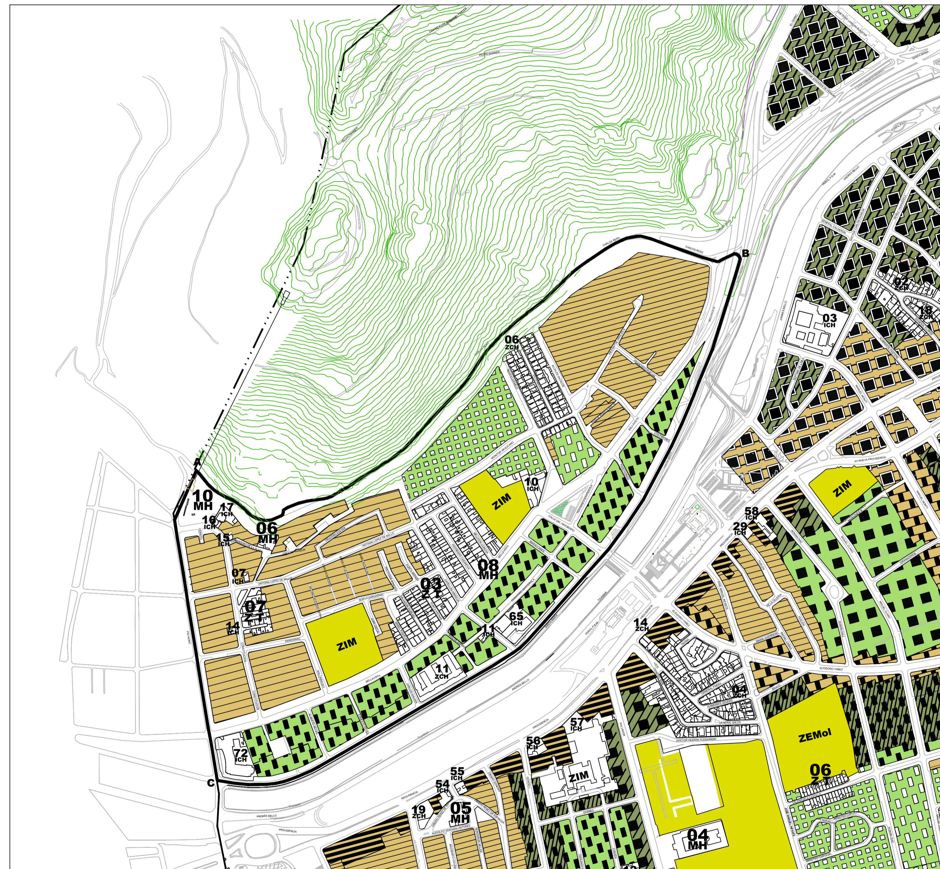
SITUACION QUE SE APRUEBA MODIFICACION Nº 2 PRCP 2007 PLANO DE EDIFICACION BARRIO BELLAVISTA ESCALA 1:5.000

SIMBOLOGIA LINEAS --- LIMITE COMUNAL [ ] AREA DE MODIFICACION