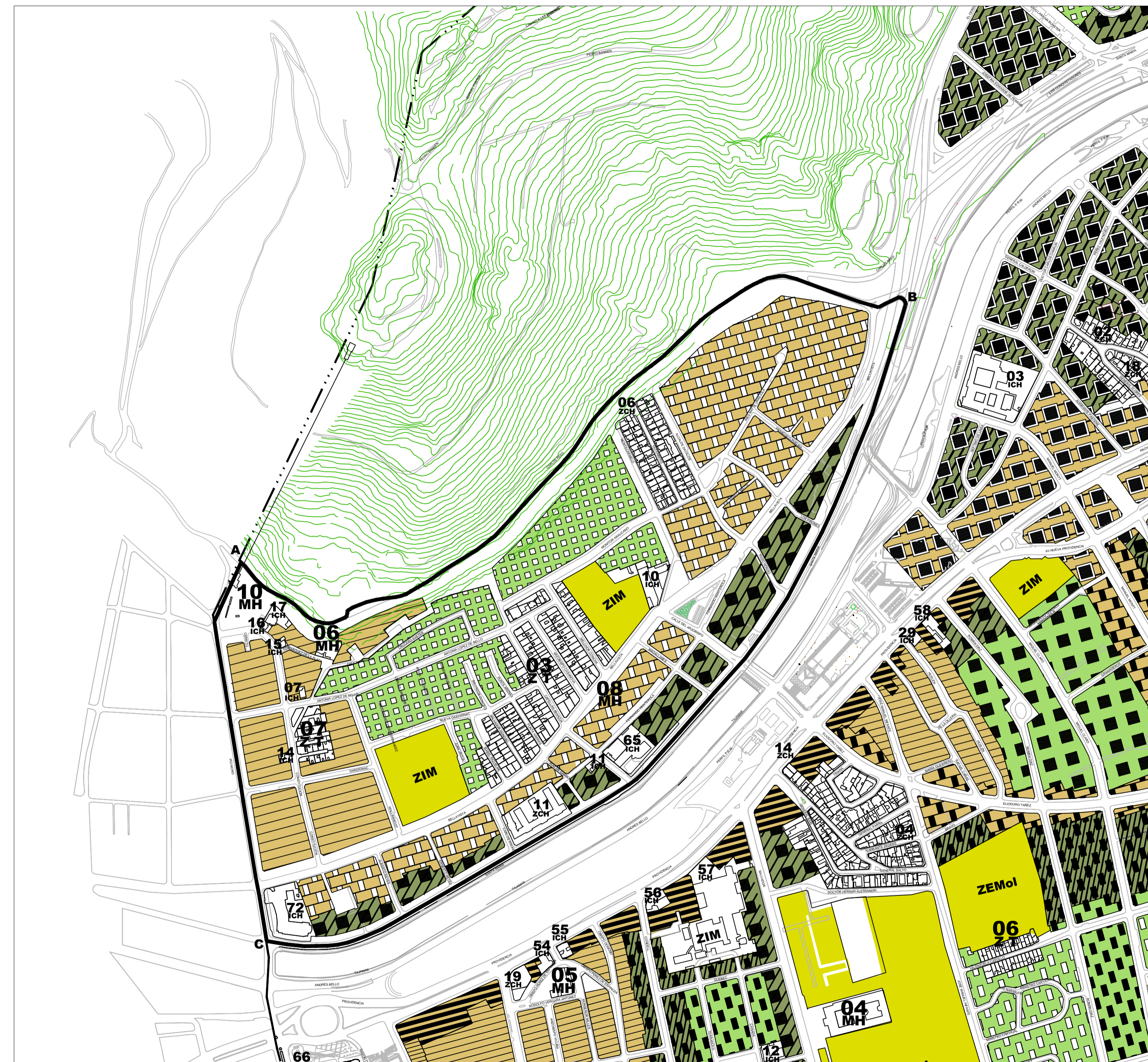
SITUACION ANTERIOR PLAN REGULADOR PRCP 2007 PLANO DE EDIFICACION BARRIO BELLAVISTA ESCALA 1:5.000